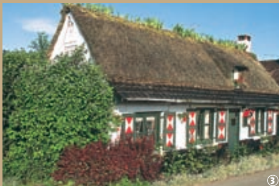
③ Chaumière traditionnelle

au bois, le Houtland flamand sur les rives de l'Yser. Ici, les fermes et les chaumières, aux murs de torchis et aux volets rouge, blanc ou vert se parent de signes runiques, en forme de losange ou de cœur, symboles de fécondité. C'est au cœur de ce pays de bocage, que se situe Broxeele, au confluent de l'Yser, qui dit-on y prend sa source, et de la Reine Becque (Koningine Becque). Broxeele, déformation de Broekzele, signifie « demeure dans le marais », c'est vous dire l'importance de l'eau pour le village. Cette fameuse eau, loin d'être toujours la bienvenue, a parfois même été perçue comme un véritable fléau quand elle provoquait des inondations, noyant les cultures et coupant les routes. Quand la goutte d'eau fait déborder le bocage !