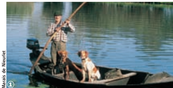
Marais de Nieurlet ①

Broxeele, Buysseure, Lederzeele, Nieurlet, Saint-Momelin, Volckerinckhove, Wulverdinghe 30 km